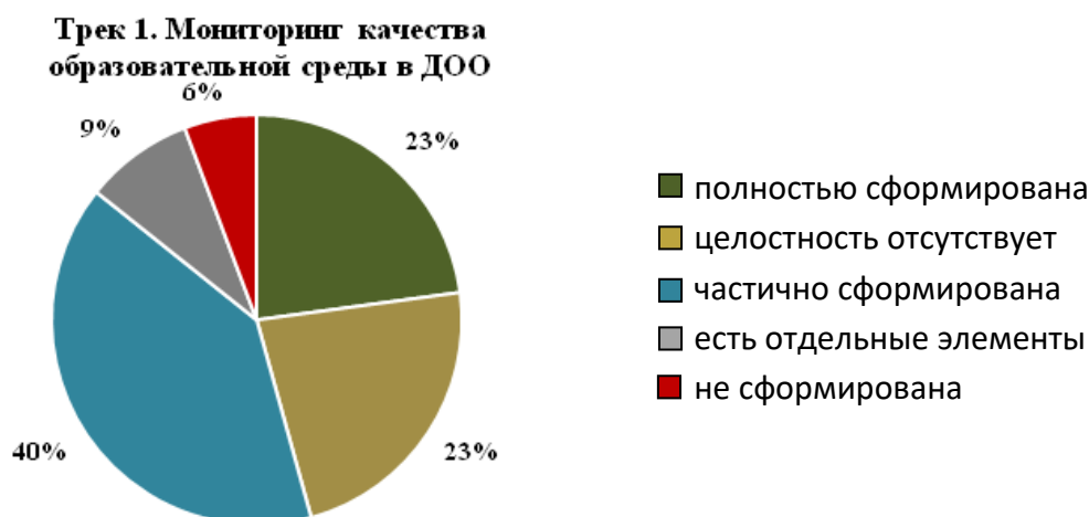
Рисунок 2. Мониторинг качества образовательной среды в образовательной организации, реализующей программы дошкольного образования

Оцениваются принимаемые меры на основе анализа муниципального уровня регионального мониторинга.